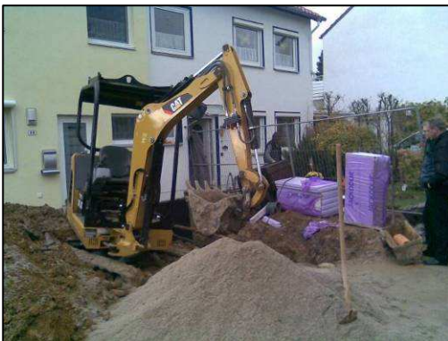
links: Baggerarbeiten auf dem Grundstück

Bei Hausinnenleitungen kommen häufig das graufarbige HT-Rohr (Hochtemperaturrohr) aus Kunststoff oder das gusseiserne SML-Rohr zum Einsatz. KG-Rohre dürfen hier nicht eingesetzt werden, da diese nicht temperaturbeständig sind! Im Hausinneren sollte insbesondere auf den Schallschutz geachtet werden.