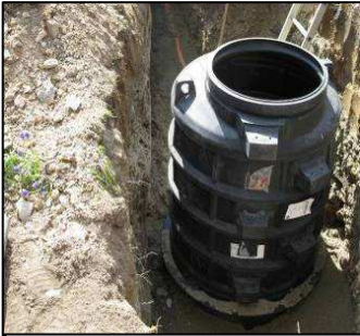
Abb.: Nachrüstung mit einem Kunststoffschacht

Bei der offenen Bauweise wird der Rohrgraben von Hand oder mit dem Bagger freigelegt und dann erneuert. Das Aufgraben kann punktuell erfolgen, um Einzel­schäden (z. B. eine Bruchstelle oder einen Rohrversatz) zu reparieren oder auch auf ganzer Länge. In der Regel wird das defekte Rohrstück herausgeschnitten und durch ein neues Rohr ersetzt, welches mit dichten Manschetten verbunden wird.