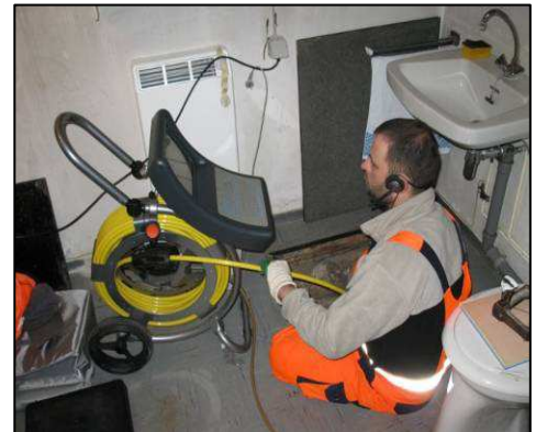
Abb.: Untersuchung mittels geschobener Kanalkamera von einer Revisionsöffnung aus

Austretendes Abwasser führt zu Umweltbelastungen, eintretendes Grundwasser zur zusätzlichen Belastung des Abwassernetzes und damit zu erhöhten Abwasserbeseitigungskosten. Um einen ordnungsgemäßen Betrieb sicherzustellen, müssen schadhafte Kanäle auch im eigenen Interesse frühzeitig saniert werden.