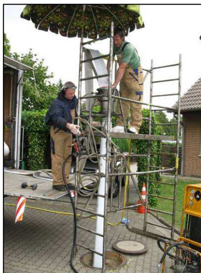
Abb.: Einbau eines Schlauchliners mit größerem Durchmesser (Anlagen für den Gebrauch innerhalb eines Gebäudes sind entsprechend kleiner)

Im Vorfeld der Sanierung sollte das Rohr mittels Kanalkamera inspiziert werden, und vor dem Einbau mittels Hochdruckspülung von allen Ablagerungen befreit werden. Insbesondere Kurzliner neigen dazu, bei verkrusteten oder verfetteten Rohren sich später wieder abzulösen und selbst zu einem Ablaufhindernis zu werden.