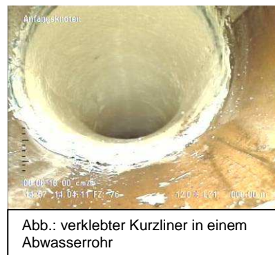
Abb.: verklebter Kurzliner in einem Abwasserrohr

Kurzliner: Ein bis zu 50 cm langer Gewebeschlauch wird mittels Packer, einer Art Gummiblaste, unter Zuhilfenahme einer Kanal-kamera bis zur Schadstelle geschoben (z. B. mit einem Gestänge). Der Packer wird mit Luft aufgeblasen, so dass sich der mit Kunstharz getränkte Gewebeschlauch formschlüssig an die Wandung presst. Dort verklebt der Kurzliner mit dem Altrohr und härtet aus und der Packer wird wieder herausgeschoben. Angewendet wird das Verfahren eher bei punktuellen Einzelschäden, z. B. wird damit ein Riss abgedichtet. Das Setzen mehrerer Kurzliner nacheinander sollte vermieden werden. In solchen Fällen ist ein Schlauchliner wirtschaftlicher! Bitte beachten Sie, dass Kurzliner eine kürzere Lebenszeit besitzen und in der Regel nur als Sofortmaßnahme für einen kurzen Zeitraum Anwendung finden.