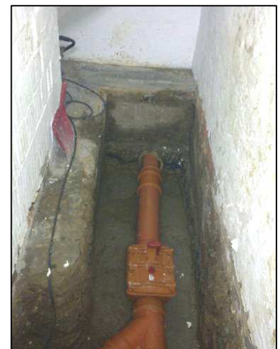
Abb.: eine erneuerte Abwasserleitung im Kellergeschoss mit Inspektionsöffnung

Die Wahl zwischen einer offenen und einer grabenlosen Sanierungslösung hängt wesentlich von den Schäden und Randbedingungen ab. Im Folgenden werden die wichtigsten Sanierungsverfahren vorgestellt: