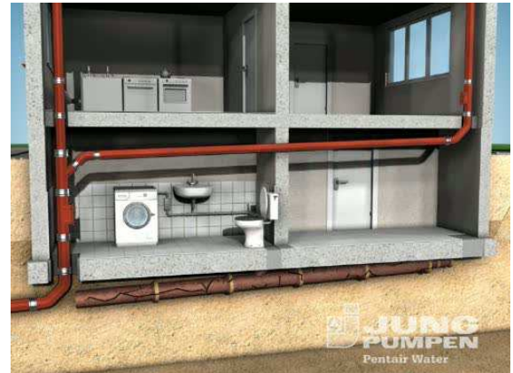
Abb.: Erneuerung einer schwer zugänglichen Leitung durch stilllegen des Altröhres und abhängen der neuen Leitung unterhalb der Decke