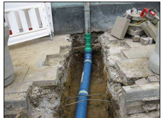
rechts: Erneuerung einer Regenwasserleitung in offener Bauweise

Darauf sollten Sie vor der Sanierung achten: