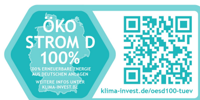
Jobst Jenckel KlimalInvest Green Concepts GmbH

Die Entwertung gem. § 30 der Herkunfts- und Regionalnachweis-Durchführungsverordnung wird über das Ökostrom-Herkunftsnachweisregister des Umweltbundesamtes durchgeführt und bestätigt.