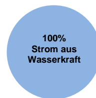
Gesamtstromlieferung Stadtwerke Wolfenbüttel